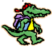
il cocodrillo verde →

Scrivi al plurale le parole accanto alle figure, Segui l'esempio_