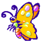
la farfalla colorata →