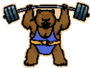
l'orso forte →