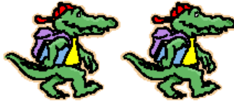
i cocodrilli verdi